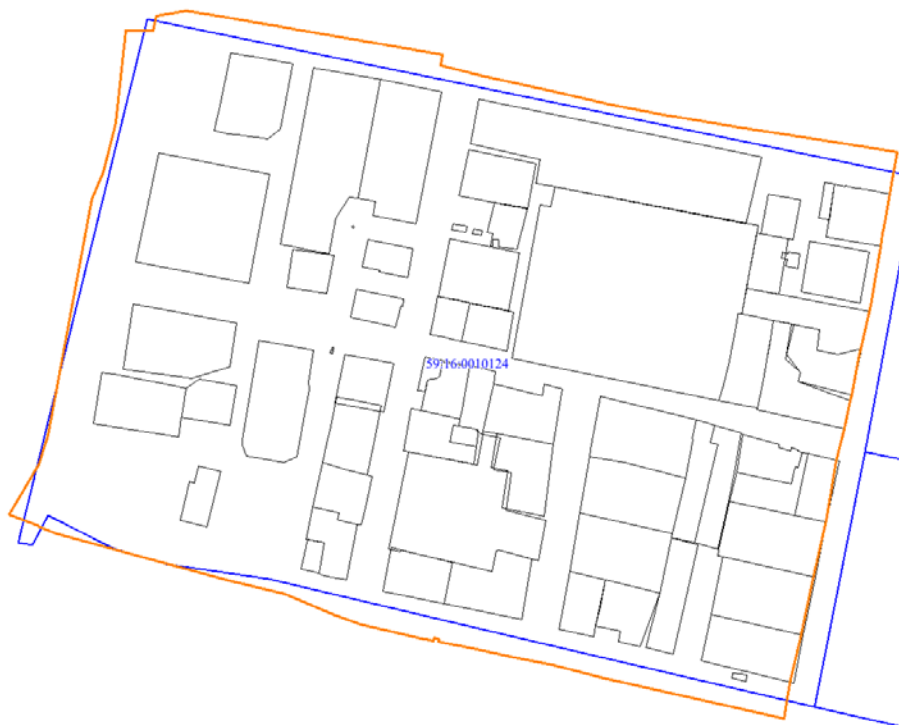
Рис. 1 Местоположение территории проектирования

Местоположение территории проектирования представлено на рисунке 1.