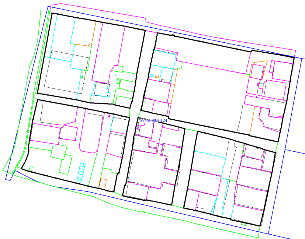
Рис.4 Местоположение утверждаемых красных линий

Проектом межевания территории предусматривается уточнение земельных участков (в том числе путем исправления реестровой ошибки). Указанная информация представлена в таблице 2, графическая часть отображена на чертеже межевания территории.