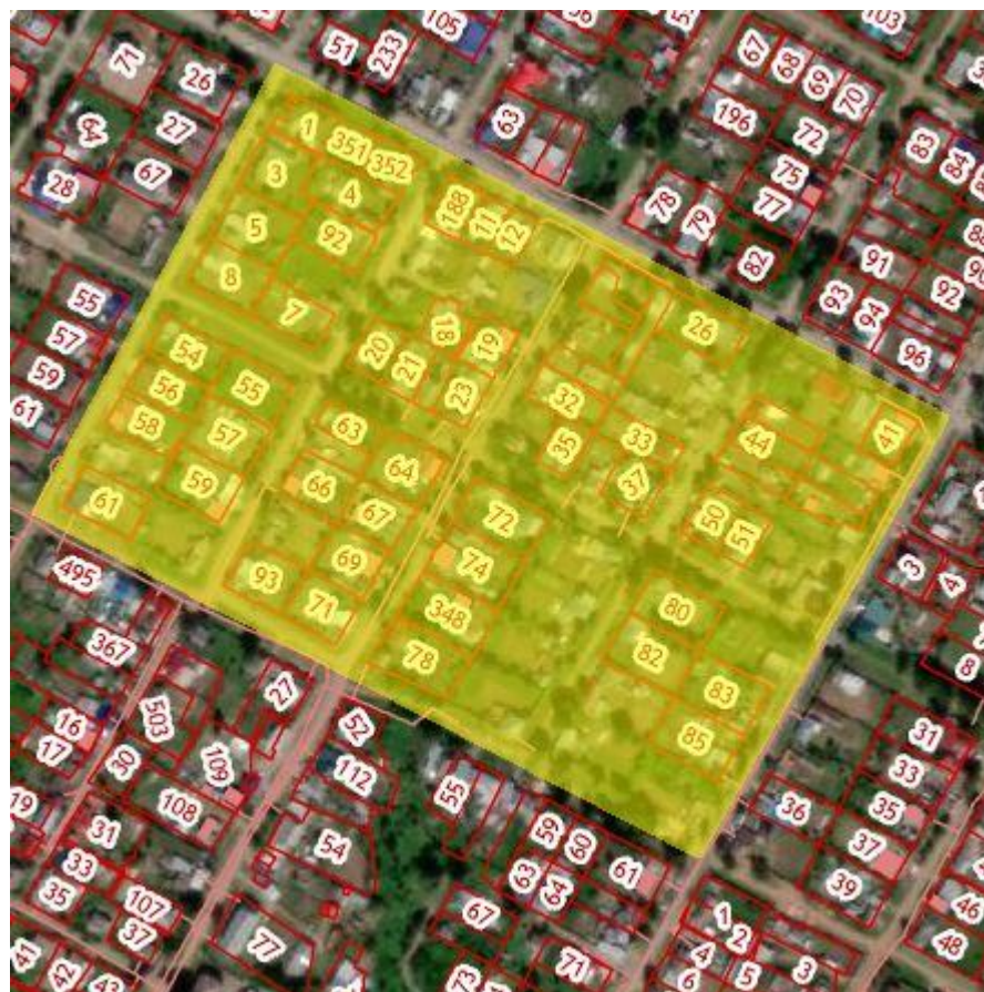
Рис.1 Местоположение территории проектирования

Местоположение территории представлено на рисунке 1.