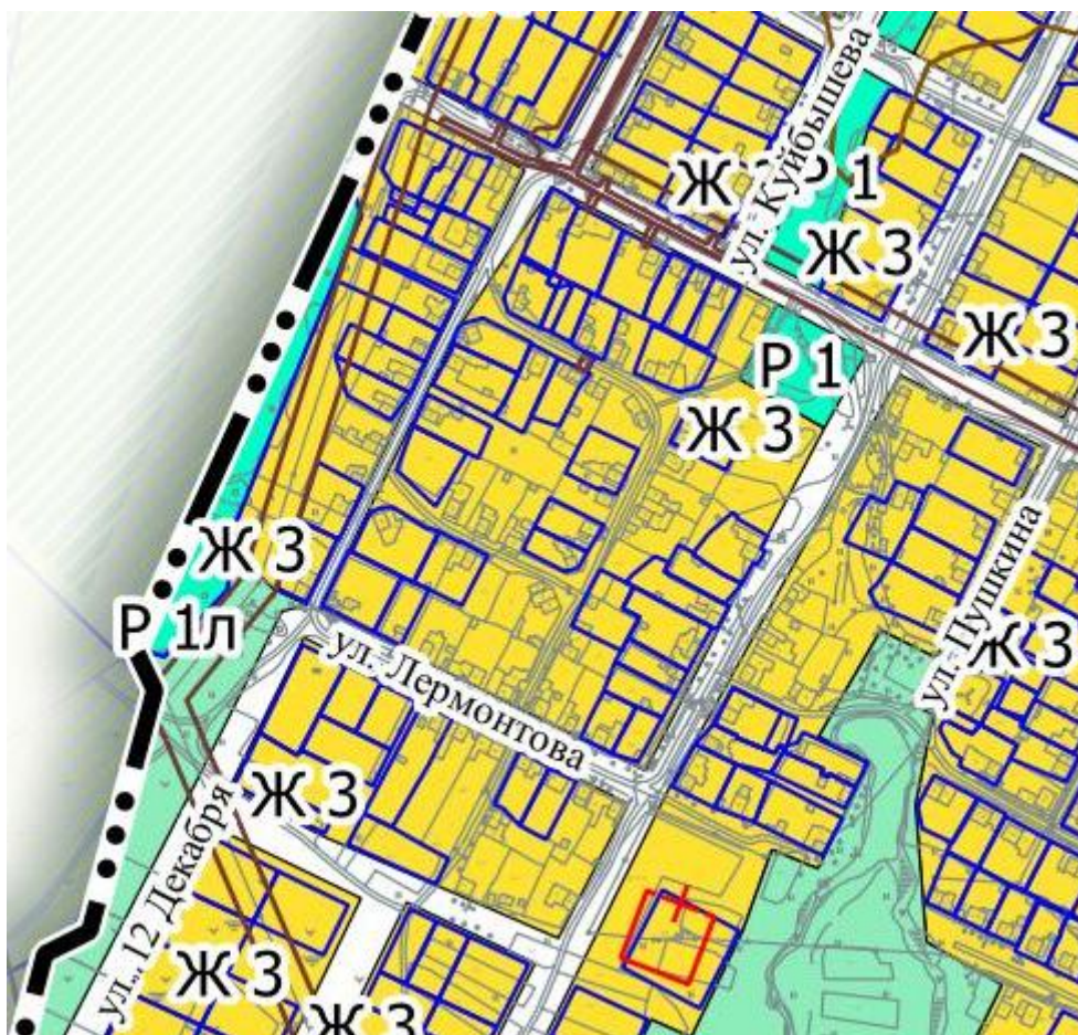
Рис.2 Фрагмент карты градостроительного зонирования г. Верещагино

Основные виды разрешенного использования земельных участков и объектов капитального строительства для зоны ЖЗ: