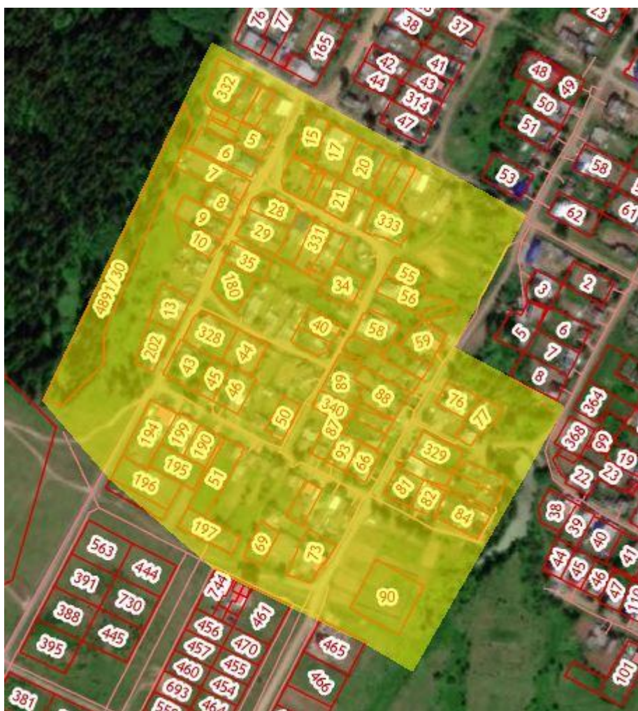
Рис.1 Местоположение территории проектирования

Территория проектирования ограничена границами кадастровых кварталов 59:16:0010322, 59:16:0010326, 59:16:0010328. Местоположение квартала 59:16:0010327, в отношении которого разрабатывается проект межевания территории представлено на рисунке 1.