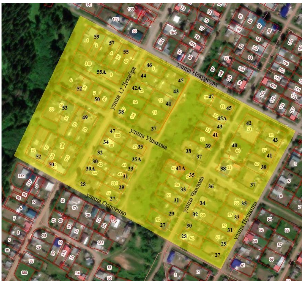
Рис.1 Местоположение территории проектирования

Площадь территории в утвержденных границах проектирования составляет 12,74 га (127440 кв.м).