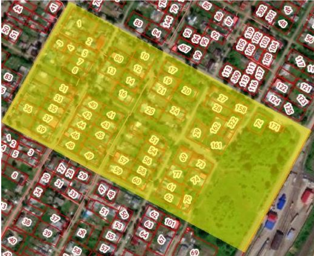
Рис.1 Местоположение территории проектирования

Проектируемая территория расположена в территории кадастрового квартала, границы которого расположены в г. Верещагино Верещагинского городского округа Пермского края, имеет прямоугольную форму, ориентированную в направлении северо-запад – юго-восток. Территория проектирования ограничена территориями кадастровых кварталов 59:16:0010319, 59:16:0010323, 59:16:0010325. Местоположение квартала 59:16:0010324, в отношении которого разрабатывается проект межевания территории представлено на рисунке 1.