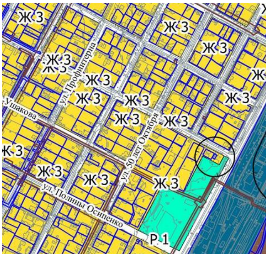
Рис.2 Фрагмент карты градостроительного зонирования г. Верещагино