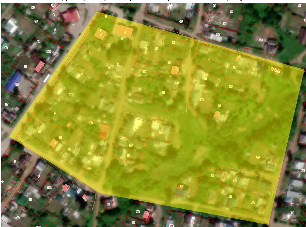
Рис. 1 Местоположение территории кадастрового квартала 59:16:0010112

Местоположение территории кадастрового квартала представлено на рисунках 1, местоположение территории проектирования представлено на рисунке 2.