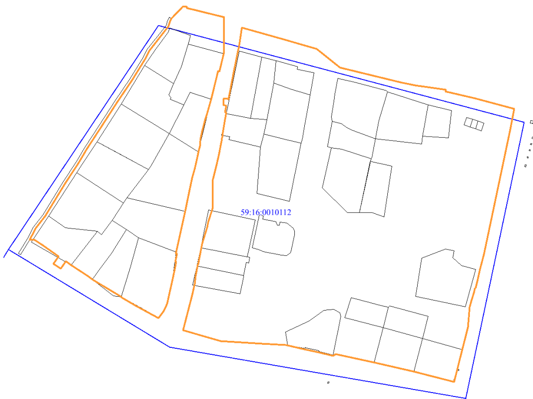
Рис. 2 Местоположение территории проектирования

Площадь территории в утвержденных границах проектирования составляет 69293,23 кв.м. (6,93 га).