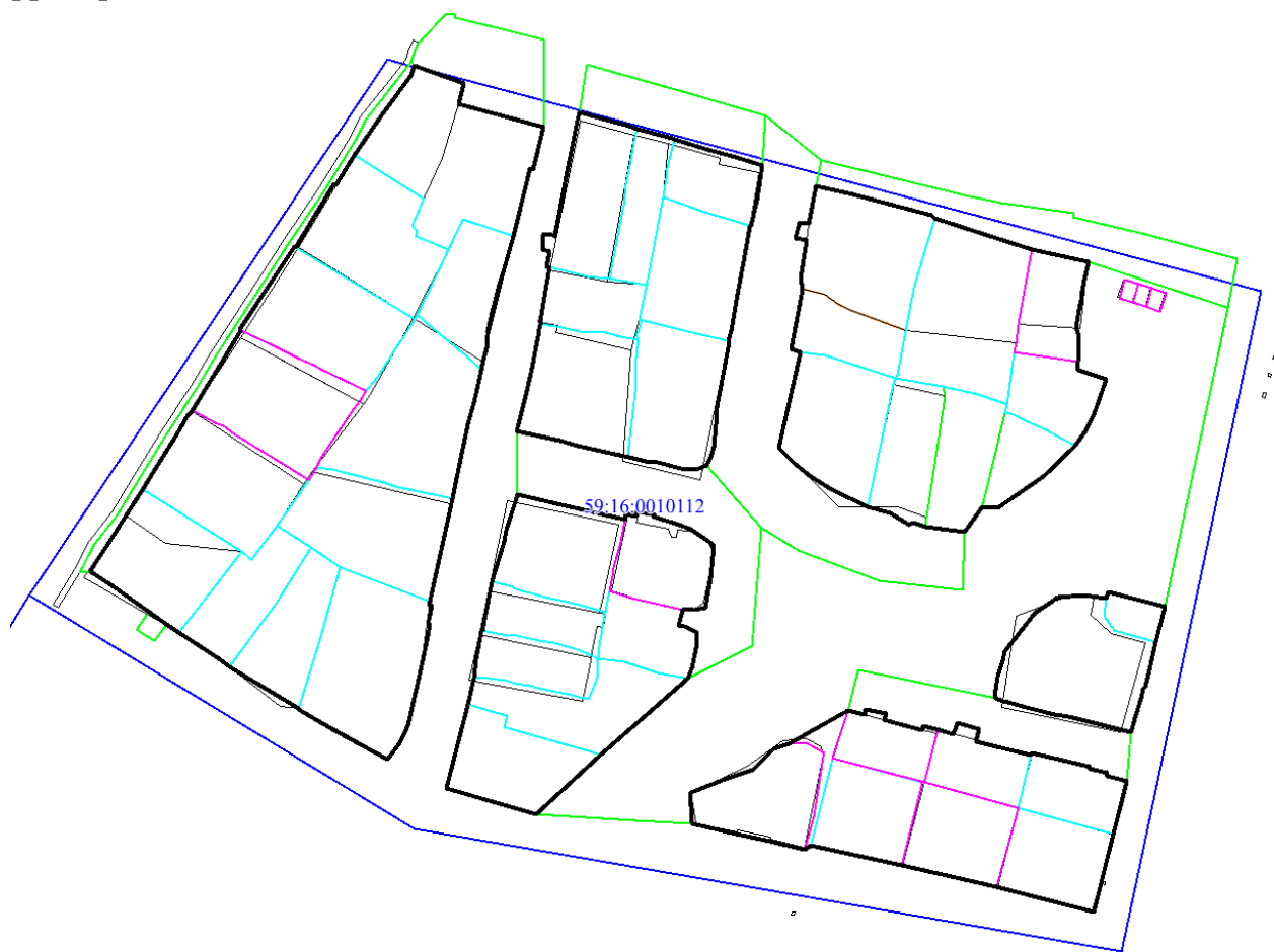
Рис.4 Местоположение утверждаемых красных линий

Проектом межевания территории предусматривается уточнение земельных участков (в том числе путем исправления реестровой ошибки). Указанная информация представлена в таблице 2, графическая часть отображена на чертеже межевания территории.