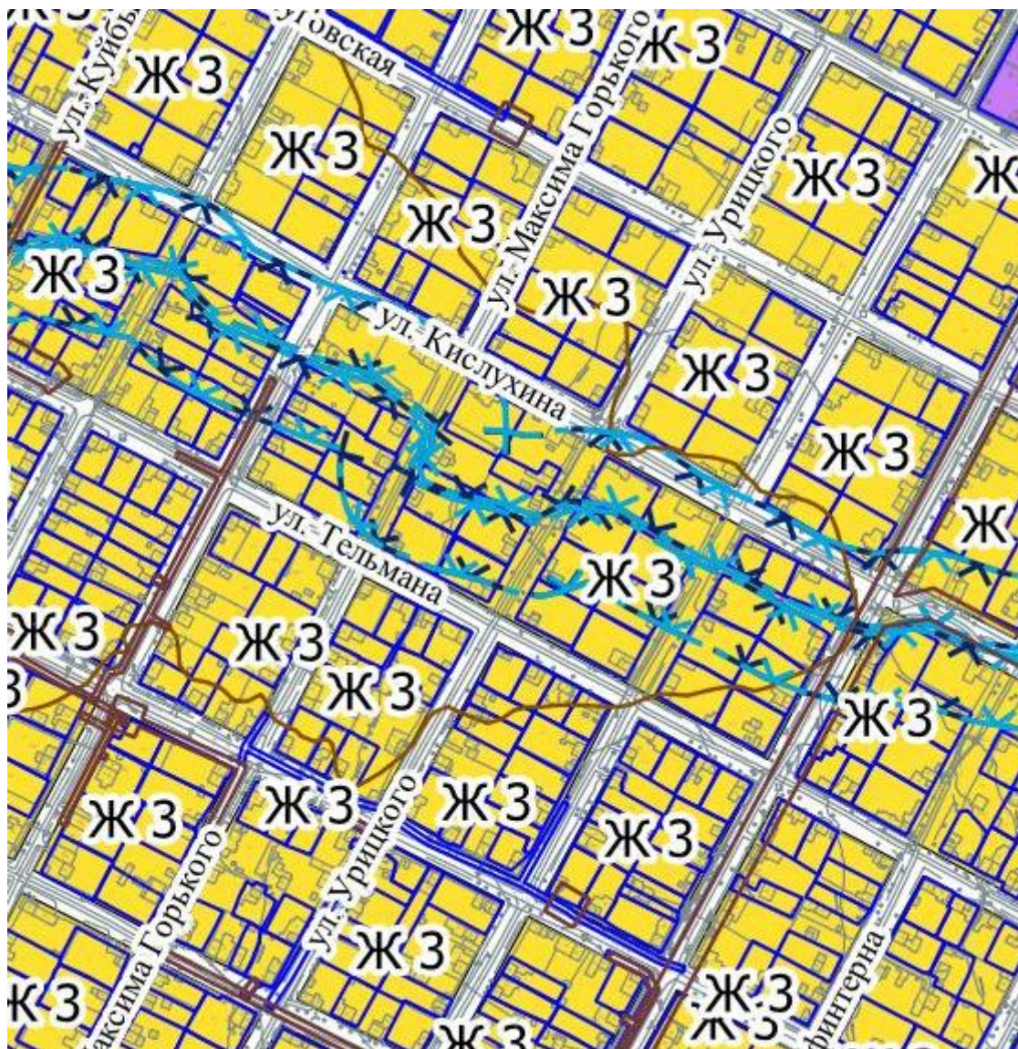
Рис.2 Фрагмент карты градостроительного зонирования г. Верещагино