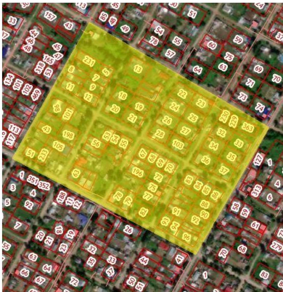
Рис.1 Местоположение территории проектирования

Территория проектирования ограничена границами кадастровых кварталов 59:16:0010316, 59:16:0010319, 59:16:0010323, 59:16:0010321. Местоположение квартала 59:16:0010320, в отношении которого разрабатывается проект межевания территории представлено на рисунке 1.