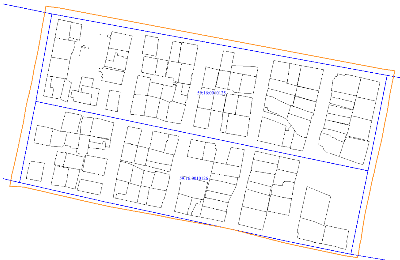
Рис. 1 Местоположение территории проектирования

Местоположение территории проектирования представлено на рисунке 1.