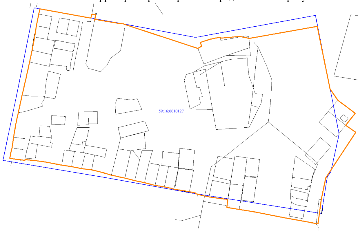
Рис. 1 Местоположение территории проектирования

Местоположение территории проектирования представлено на рисунке 1.