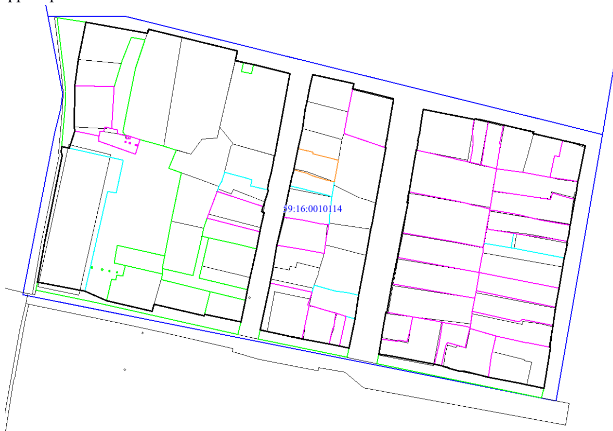
Рис.4 Местоположение утверждаемых красных линий

Проектом межевания территории предусматривается уточнение земельных участков (в том числе путем исправления реестровой ошибки). Указанная информация представлена в таблице 2, графическая часть отображена на чертеже межевания территории.