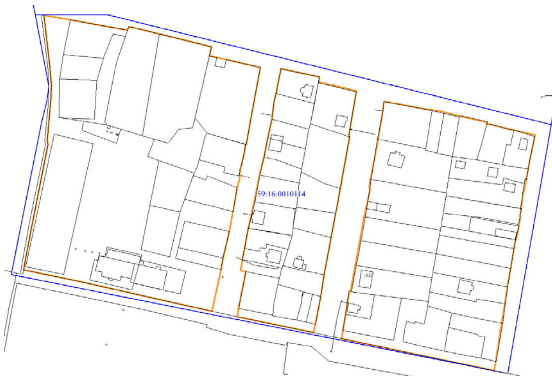
Рис. 2 Местоположение территории проектирования

Площадь территории в утвержденных границах проектирования составляет 77 316,42 кв.м. (7,73 га).