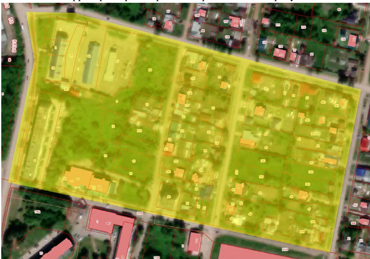
Рис. 1 Местоположение территории кадастрового квартала 59:16:0010114

Местоположение территории кадастрового квартала представлено на рисунках 1, местоположение территории проектирования представлено на рисунке 2.