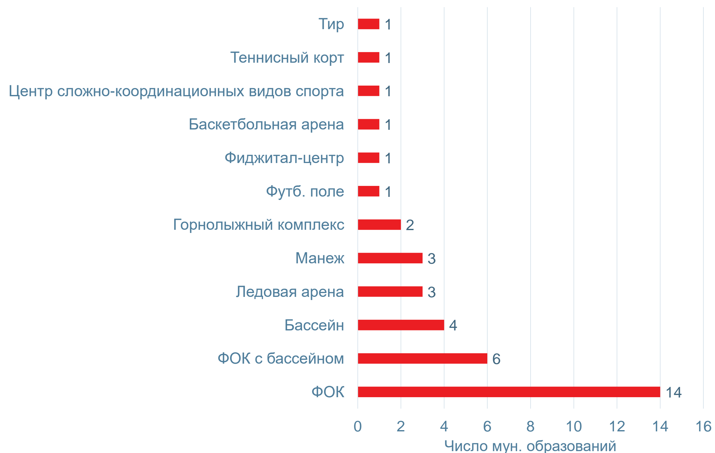
Распределение по видам объектов