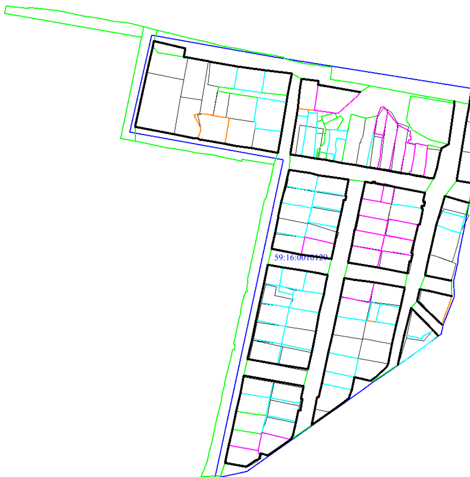
Рис.3 Местоположение утверждаемых красных линий